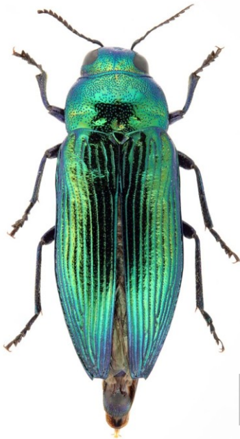
Fig. 1. Hábitus del individuo capturado en Salamanca.

E. quercus es una especie polífaga, que se ha citado sobre Castanea , diversos Quercus ( pyrenaica y cerris ) y Fagus . Los adultos vuelan principalmente en el verano y acuden a viejos árboles, incluso muertos, donde efectúan las cópulas y puestas de huevos.